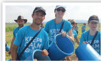
Ramassage de légumes pour des familles israéliennes dans le besoin

Membre de l'équipe des Responsables Engage International