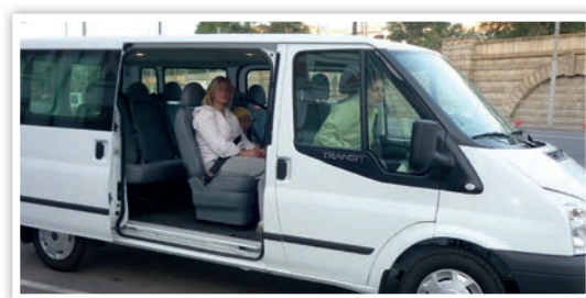
Le grand minibus que nous avons acquis grâce à vos généreux dons.

Il est significatif que l'Aliya depuis Moscou ait augmenté ces dernières années. Nous pouvons voir un grand nombre de jeunes juifs seuls, ainsi que des jeunes familles avec des enfants, retourner à la maison. Nos chauffeurs sont très occupés pendant presque toute la nuit avant un vol matinal pour Tel Aviv car ils vont chercher les familles juives et