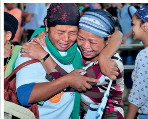
Des retrouvailles émouvantes à Ben Gurion.

accomplissement de la prophétie biblique. Même après avoir été témoins depuis tant d'années de l'arrivée des Olim en Israël, je peux dire que je ne suis jamais lassée. De telles scènes m'attendrissent toujours. Alors que je me tenais là et voyais ces 42 nouveaux citoyens du Pays, j'ai prié : 'Seigneur, s'il te plaît, garde les portes ouvertes pour beaucoup, beaucoup d'autres qui doivent revenir en Israël.' Gloire à Dieu!