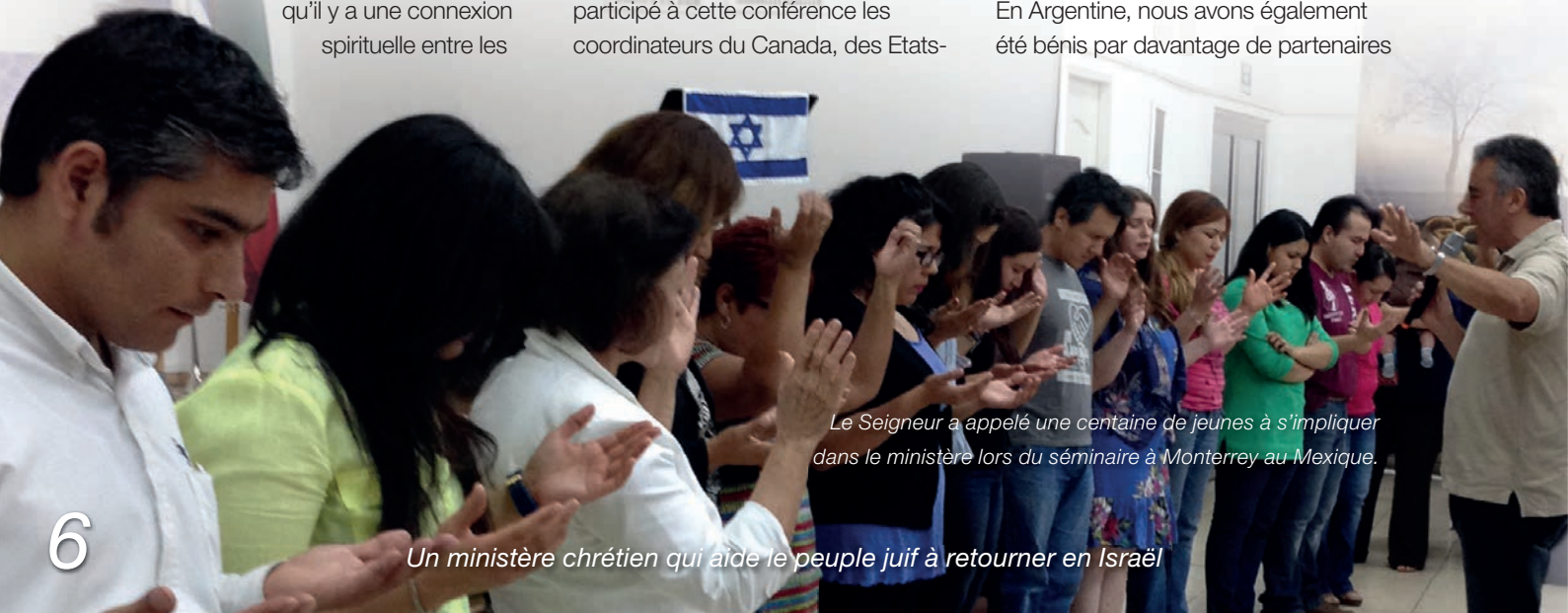
Le Seigneur a appelé une centaine de jeunes à s'impliquer dans le ministère lors du séminaire à Monterrey au Mexique.

En Argentine, nous avons également été bénis par davantage de partenaires