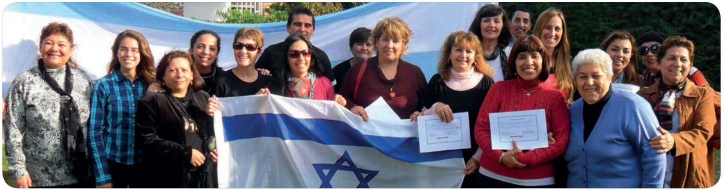
Participants au séminaire à Cordoba en Argentine.

de prière, grâce à un séminaire tenu récemment à Cordoba où un grand nombre de pasteurs étaient présents, invités lors des nombreuses visites que notre équipe a effectuées dans les églises du pays. La fondation d'Ebenezer Argentine a été finalisée, par la grâce de Dieu, en juillet.