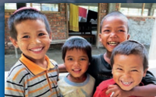
Visite des Bnei Menashe