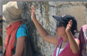
Prière sur les murs de Jérusalem

Coordinateur du voyage: Urs Käsermann — office@ebenezer.ch Tél : +41(0)24 441 69 60