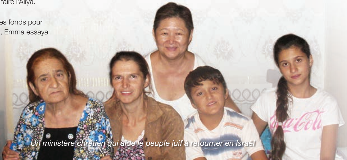
Un ministère chrétien qui aide le peuple juif à retourner en Israël