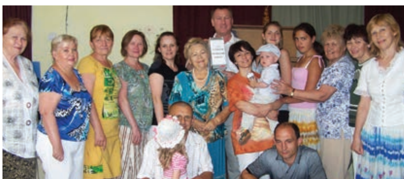
Un Pasteur et membres d'église en Russie qui soutiennent Israël et l'Aliya.

N'oubliez pas de prier spécialement pour tous nos dirigeants qui sont sur place et les équipes en Russie qui servent fidèlement le Seigneur.