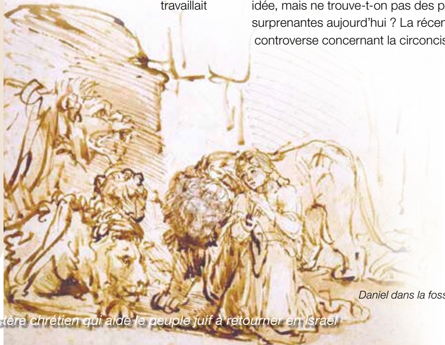
Daniel dans la fosse aux lions.

L'histoire de Daniel dans la fosse aux lions (chapitre 6) est l'une des histoires préférées de la Bible. Cet incident fut, en fait, une attaque contre l'Aliya ! L'ennemi essaya d'éliminer Daniel pour prévenir le retour des Juifs! Cela arriva juste après que le roi Darius élève Daniel à sa haute position de gouverneur. Par jalousie et sachant que Daniel était Juif, ses coéquipiers gouverneurs et les satrapes mirent en place un plan diabolique afin de se débarrasser de lui. Ils dirent : 'Nous ne trouverons aucun motif contre ce Daniel, à moins que nous n'en trouvions un dans la loi de son Dieu' (verset 6). Voilà une curieuse idée, mais ne trouve-t-on pas des parallèles surprenants aujourd'hui ? La récente controverse concernant la circoncision, les