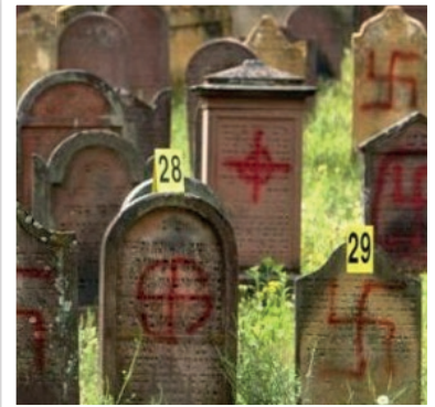
Des pierres tombales juives désacralisées.

Nous avons répondu à ces actes en exprimant notre solidarité au peuple juif par une lettre envoyée à la Communauté Juive de Rome ainsi qu'à l'Ambassade d'Israël au nom du ministère d'Ebenezer dans sa généralité. Notre message était: 'Ceux qui vous offensent nous offensent nous aussi.' Nous continuons d'aider