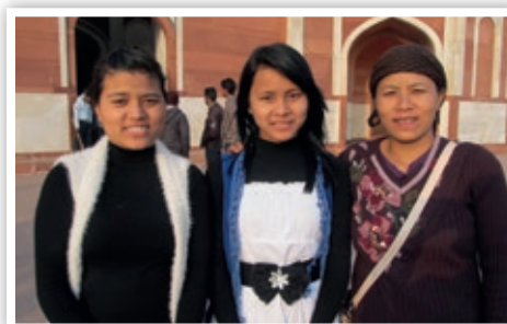
Une mère avec ses deux filles

joie de voir Son sourire alors que Son peuple bien-aimé retourne au Pays Promis !